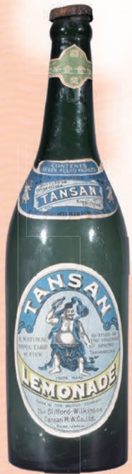
WILKINSON TANSAN LEMONADE瓶 大正3年(1914)以降 兵庫県立歴史博物館蔵

それぞれのまちの歴史を交えながら、地域の特性を活かして育まれた豊かな温泉文化を紹介します。