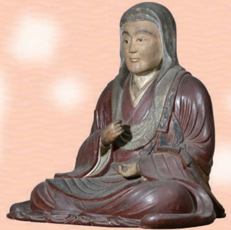
慈覚大師坐像 江戸時代 (新温泉町 正福寺蔵)