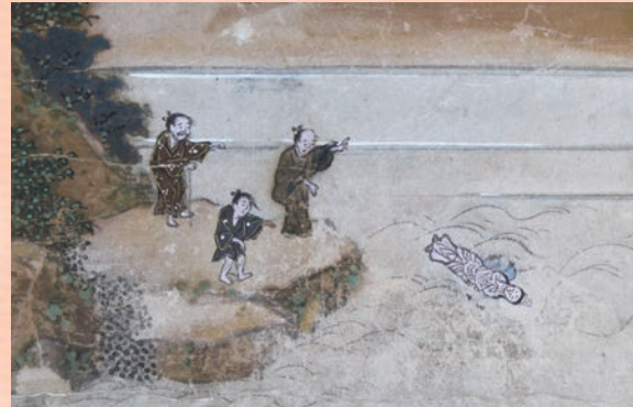
海北友竹「温泉寺縁起図」(部分) 江戸時代 (豊岡市 温泉寺蔵、豊岡市指定文化財)