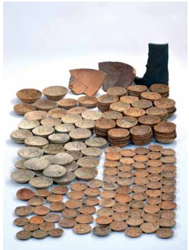
第2面土器溜出土遺物