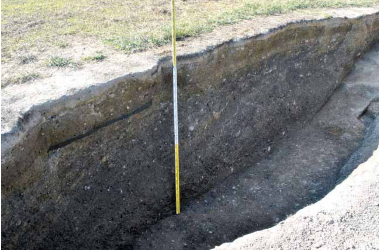
赤松居館跡 第2遺構面から第1遺構面の整地層土層断面