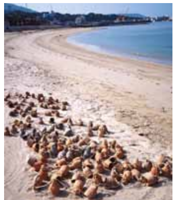
▲淡路市の富島遺跡出土のイダコ壺 (6～8世紀)

会場 洲本市文化体育館文化ホール (固定 548 席) (兵庫県洲本市塩屋 1-1-17 ☎0799-25-3321) 主催 兵庫県立歴史博物館ひょうご歴史研究室 淡路島日本遺産委員会 【構成団体】洲本市・洲本市教育委員会・南あわじ市・南あわじ市教育委員会・淡路市・淡路市教育委員会・淡路県民局 (一財)淡路島くにうみ協会・(一社)淡路島観光協会・(一社)淡路青年会議所 後援 兵庫県立考古博物館