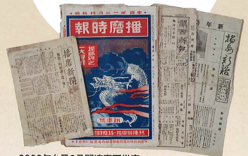
2009年台風9号関連豪雨災害でレスキューされた西播の地域紙類 大正12年(1923)~昭和8年(1933)(個人蔵、当館寄託)