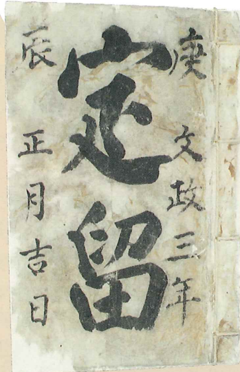
岩手県指定文化財 吉田家文書のうち 定留 江戸時代(個人[大庄屋吉田家]蔵)