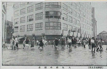
阪神大水害絵はがき 昭和13年(1938)