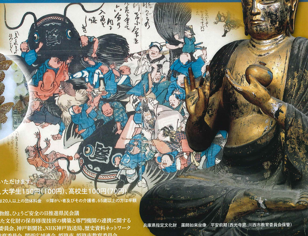
兵庫県指定文化財 薬師如来坐像 平安前期(西光寺蔵、川西市教育委員会保管)