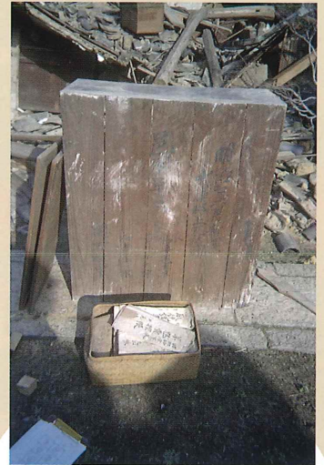
阪神・淡路大震災でレスキューされた武庫郡上瓦林村の重要書類引き継ぎ筆筒 明治7年(1874) (個人蔵、西宮市立郷土資料館寄託)