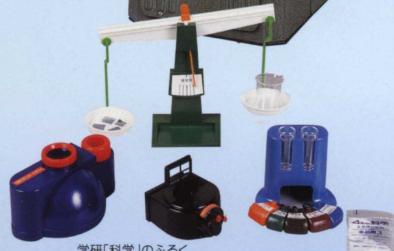
学研「科学」のふろく