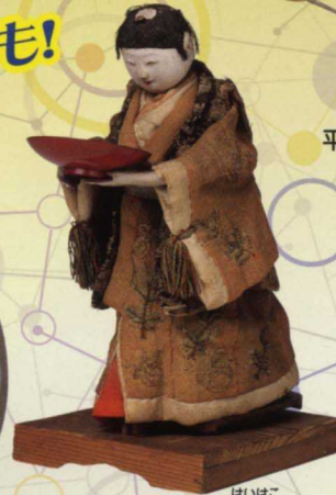
はいはこ 盃運び人形