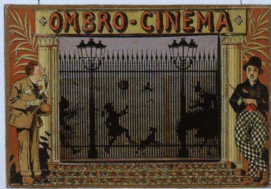
オンブローシネマ