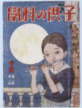
子供の科学 創刊号