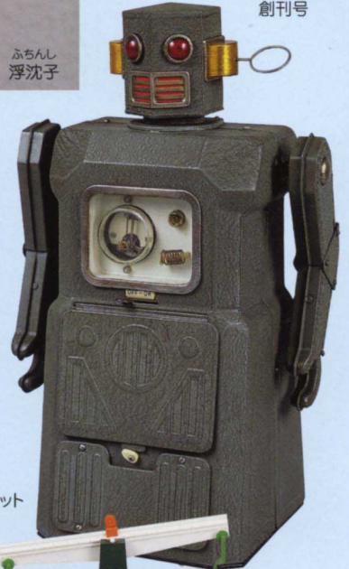
ラジコンロボット