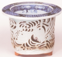
東山徳斎楽庵付西尾製文様木鉢