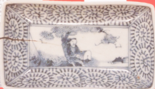
出石焼料理店人文角屋山口コレクション