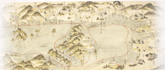
〔西海航路図〕