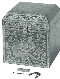
漆塗雲龍文戩金印箱 (毛利博物館蔵 重要文化財)

瀬戸内海は、古くから九州と畿内とを結ぶ物流の大動脈としての役割を果たしてきました。近年の中世考古学の飛躍的發展により、瀬戸内を舞台とした流通のあり方が具体的にたどれるようになっています。