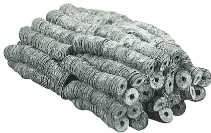
草戸千軒町遺跡出土土銭塊 (広島県立歴史博物館蔵 重要文化財)