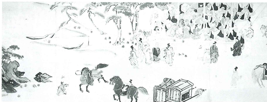
遊行縁起絵巻(真光寺蔵 重要文化財)