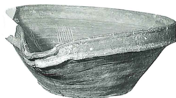
百間川遺跡群出土備前焼播鉢 (岡山県古代吉備文化財センター蔵)