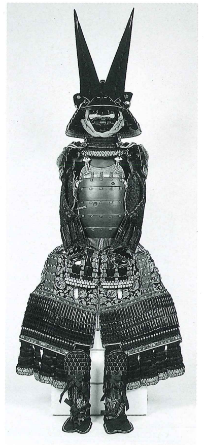
紺糸素懸桶側胴具足

◆関連講座／県博歴史ゼミナール 4月28日(日)午後2時から テーマ／「館蔵の名品Ⅰ-城郭・民俗編-」 講師／堀田浩之(当館主査・学芸員) 香川雅信(当館学芸員) 5月25日(土)午後2時から テーマ／「館蔵の名品Ⅱ-美術・歴史編-」 講師／神戸佳文(当館学芸課長) 前田 徹(当館学芸員) 場所／いずれも当館講堂(先着順)