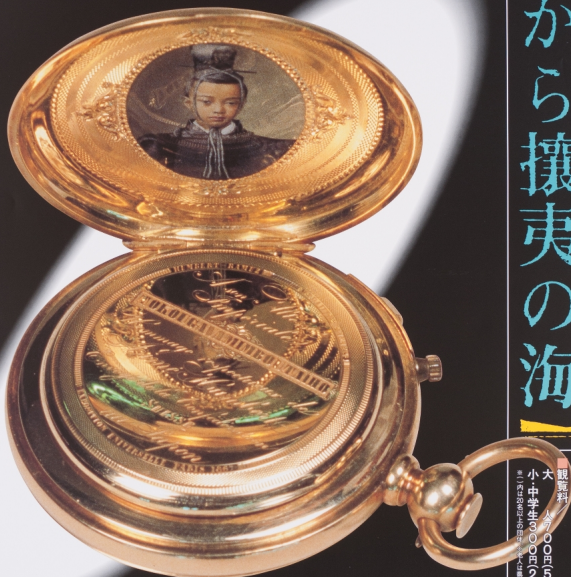
金匱屋純村翁公(徳川昭武)写真入懐中時計