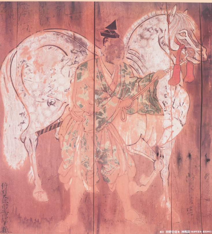
墨文 狩野元信筆 神馬図 (肥後町宮津 賢茂神社)

講演『絵馬をたずねて』10/13日PM2:00 於講堂 講師/国立歴史民俗博物館 教授 岩井 宏實氏