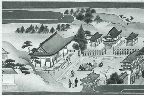
有馬温泉寺縁起絵巻 江戸時代 当館蔵(2月19日から場面替えます)