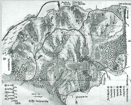
播磨国淡河北畑村の山の絵図 江戸時代 当館蔵