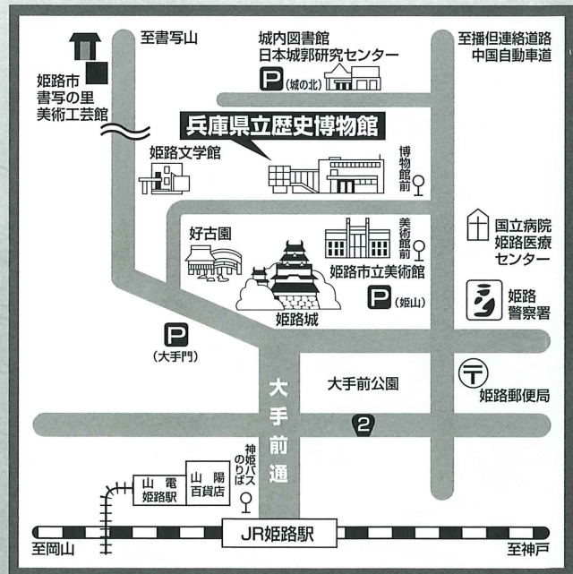
背景写真/海浜図屏風 江戸時代 当館蔵

駐車場/博物館に駐車場はありません。有料駐車場(姫路市営城北、姫山駐車場)をご利用ください。大型バスでご来館の場合は、事前に博物館にご連絡ください。